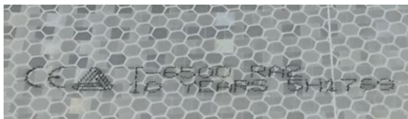
Figura 1 – Tela retrorrefletora Sinalux evidenciando marca indelével

Considerando um ângulo de observação \alpha de 0,2° (12') e um ângulo de entrada de +5°, para a classe RA2 os valores para o coeficiente de retrorreflexão são os seguintes: