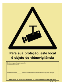
a) P 35 71

De acordo com do DL 135/2014, de 8 de setembro.