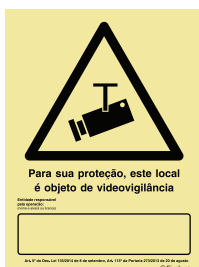
P 35 73