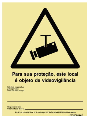
P 35 75