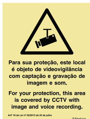
P 35 76

De acordo com a Lei n.º 52/2013 de 25 de Julho.