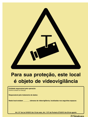
a) P 35 72

De acordo com a Lei nº 34/2013, de 16 de maio e Portaria 273/2013, de 20 de agosto.